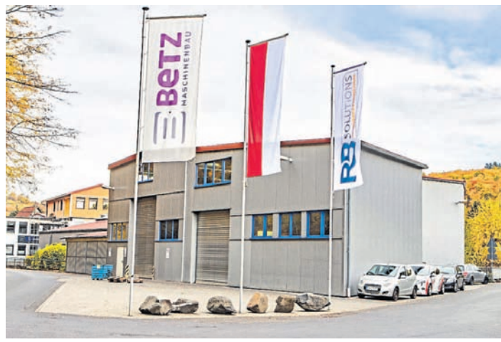
Aus der Heinrich Betz GmbH & Co. KG in Ortenberg-Lißberg wird RB Solutions.