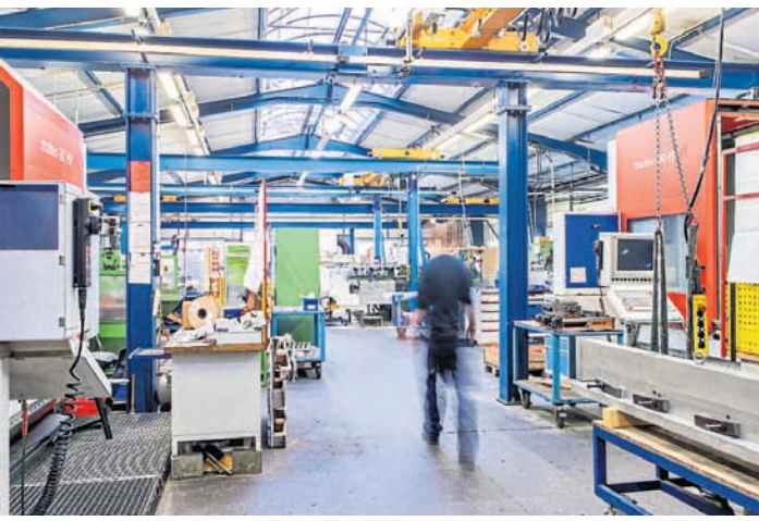
Ein Blick in eine der modernen Produktionshallen: Die Fräse- rei für Kleinteile.